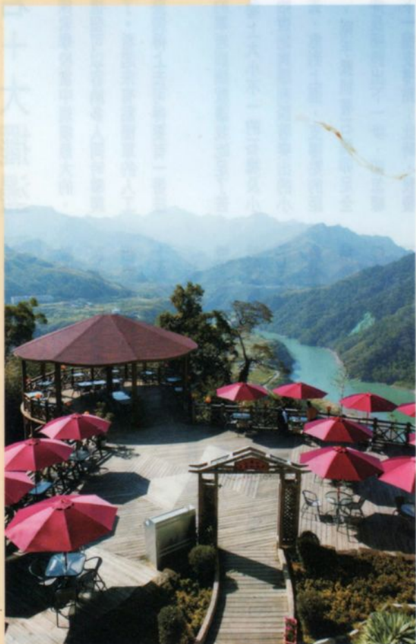
▲比雅山咖啡 甘醇好喝而 且有著無比的絕佳視野。