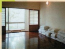
青年活動中心的客房 不算豪華但是乾淨又舒服。